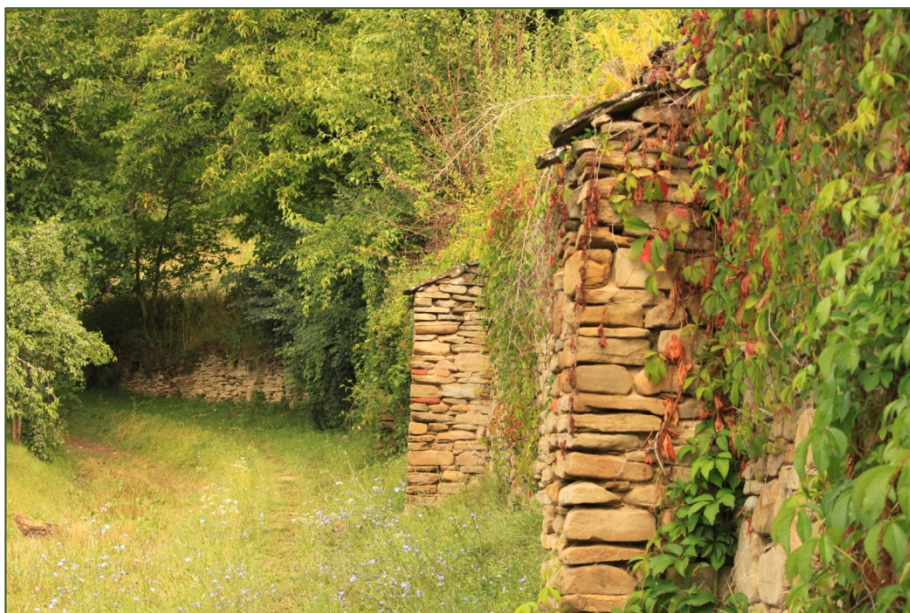
Westliche Ringmauer der Nadescher Kirchenburg im August 2015.