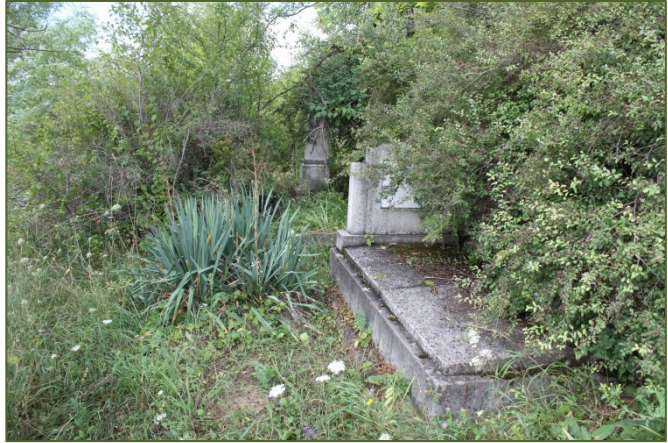
Zugewachsene Gräber im oberen Friedhofteil

Der relativ geringe Geldbetrag von 250 € den wir jährlich für die Friedhofsrei-