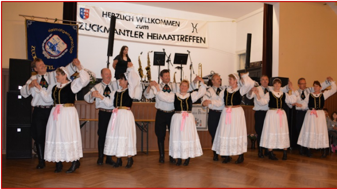
Oben: Auftritt am Zuckmantler Heimattreffen, am 15. Oktober 2015 in Nürnberg