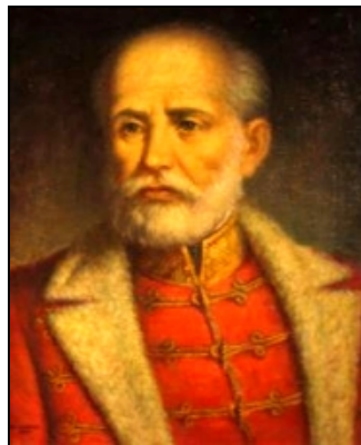
Joseph Bem (1795-1850)

te. Sie steigerte sich immer mehr, während das Kantorenehepaar beflissen Speisen und guten Kokelwein auftrug und das benutzte Gedeck auswechselte. Bald stand Petöfi gestiefelt und gespornt auf dem Tisch und trug mit ungarischem Schwung seine Gedichte vor. Schließlich begab man sich zu kurzer Ruhe. Im Morgengrauen ritten die Krieger in Richtung Schäßburg davon, wo die Schlacht geschlagen wurde, in deren Verlauf beide Adjutanten Bems den Tod finden sollten.