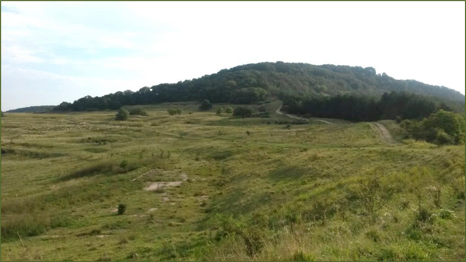
Blick auf das Nadescher Gott-sei-Dank-Reech

dann noch zufällig ehemalige Kollegen und Freunde auf dem Markt in Schäßburg trifft, die man 25 Jahre nicht gesehen hat, wird einem auch warm ums Herz. Ein Spaziergang mit meinem Bruder nach Pipe weckte viele Erinnerungen an unsere Kindheit. Immer wieder blieben wir stehen und ich schaute hinauf zum blauen Himmel, der sich unendlich über unseren Köpfen ausbreitete. Von der warmen Mittagssonne umgeben schritten wir den gewundenen Weg am „Ka-