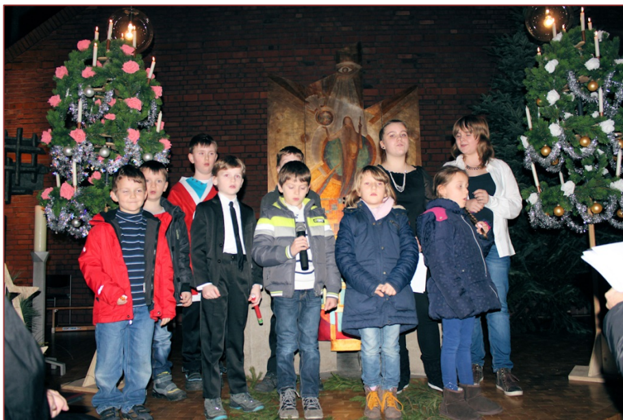
Kinderprogramm am Adventsgottesdienst

Anschließend sollte sich das Licht der Kerzen durch den ganzen Gottesdienst ziehen. So haben wir uns zusammen mit den Kindern und Eltern im Vorfeld dafür entschieden, einfach mal aus Sicht der Ad-