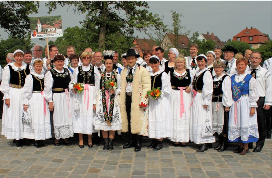
Trachtenträger der HOG Nadesch beim Heimattag 2015.

In diesem Rahmen beteiligte sich die HOG Nadesch aktiv an der Ausstellung „Einblicke ins Zwischenkokegebiet“, an der Brauchtumsveranstaltung „Hochzeitsbräuche im Zwischenkokegebiet“ und beim Abzeichenverkauf am Wörnitztor.