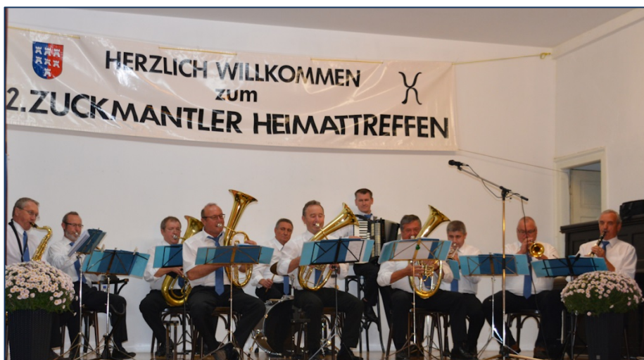
Zuckmantler Treffen in Nürnberg-Eibach