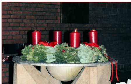
Adventskranz Nikodemuskirche 2014

Wie jedes Jahr begann der letzte Adventsgottesdienst mit unseren Freunden, den Johanniter und dem Friedenslicht. In Bethlehem wird´s entzündet, zieht von Land zu Land und wirbt für Einigkeit, Menschlichkeit, Frieden und Hoffnung. Auch wenn es jedes Jahr wiederkehrt – alle von uns sollten dieses Licht des Frieden für immer in sich bewahren.