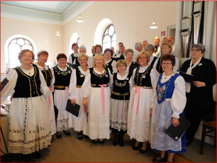
Am Heimattag, in der St.-Pauls-Kirche in Dinkelsbühl

schauer begeisterte mit den beiden schönen, sehr gefühlvoll gesungenen Liedern: „Sonne leuchte mir ins Herz hinein“ und „Iwer de Stopeln“.