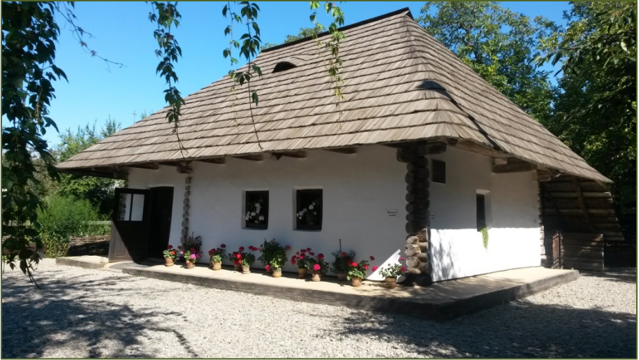
Geburts- und Wohnhaus von Ion Creangă in Humulești

Nachdem wir uns mit frischen grünen Bohnen und roten Zwiebeln aus ihrem Garten eingedeckt hatten, fuhren wir weiter zu den Klöstern „Dorotheia“, „Voronet“, „Humorului“ und später nach Suceava. In kurzer Zeit erreichten wir aufgrund der sehr guten Straßen ein Hotel in Tirgu Neamt. Am nächsten Tag besuchten wir das Haus des berühmten rumänischen Schriftstellers Ion Creanga in Humulesti und das Kloster Agapia mit dem angrenzenden Haus des Autors Alexandru Vlahuta. Einen schönen Nachmittag verbrachten wir in Piatra Neamt bei einer Freundin auf der Terrasse. Von dort ging es weiter über Cheile Bicazului, Lacul Rosu, Miercurea Ciuc, Sfintu Gheorghe nach Kronstadt. Fünf Tage Entspannung in der frischen Luft unter der Zinne. Nach deutscher Zeit waren wir abends um neun Uhr schon im Bett. Ein Tagesausflug nach Hermannstadt und auf dem „Transfagarasean“ hinauf zum Bâlea-See, vorbei an schwindelerregenden Schluchten war nicht wenig aufregend. Die Fahrt nach Nadesch brachte viel Aufregung mit sich. Das Packen machte uns zu schaffen, denn wir hatten auf der Reise so viele kulinarische Kostbarkeiten eingekauft und somit das Auto so schwer beladen, dass wir nur mit Mühe ein und –aussteigen konnten. Aber bei dem schönen Wetter, das uns auf unserer ganzen Reise begleitet hatte, fiel uns alles viel leichter. Wenn man