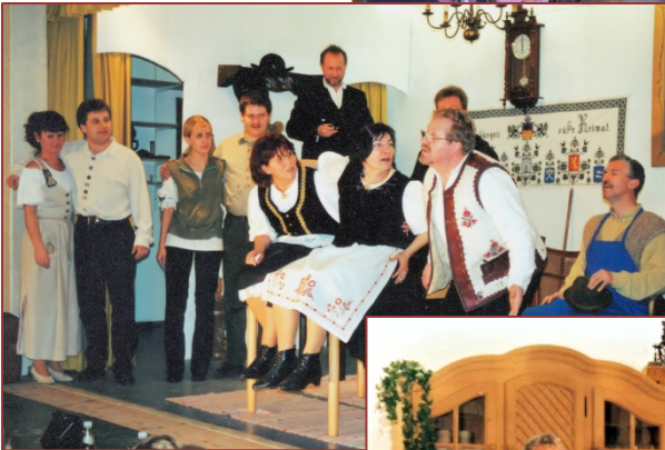
Droa Fronjderkniacht, 2004