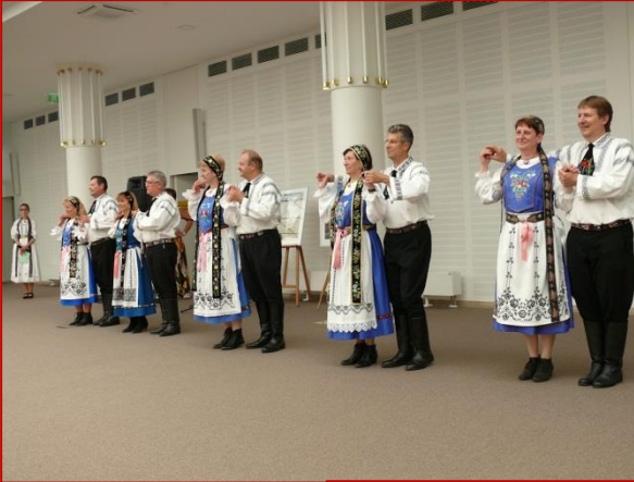
Links: Aussiedlerkultur- tage im Atrium des Heimatministeriums am 4. Juli 2015