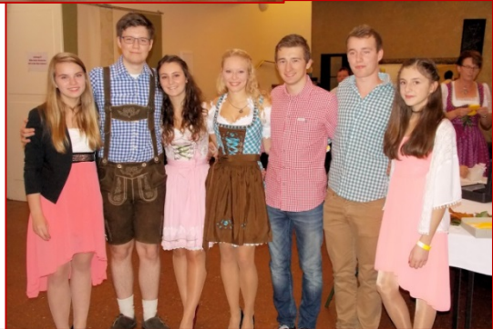
Unten: Gruppenfoto vom Kathreinenball, am 7. November 2015.