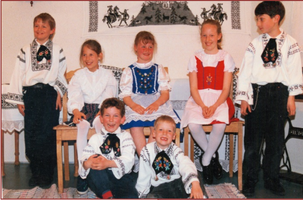
Der Herr Lihrer kitt, 1996 (mitwirkende Kinder)