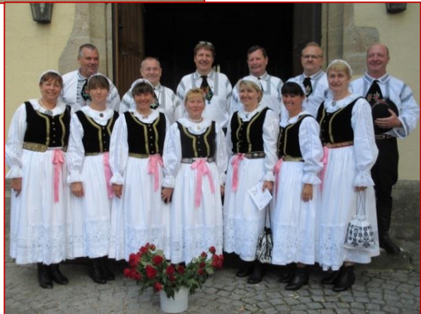
Hochzeit in Weißen- burg am 22. August 2015