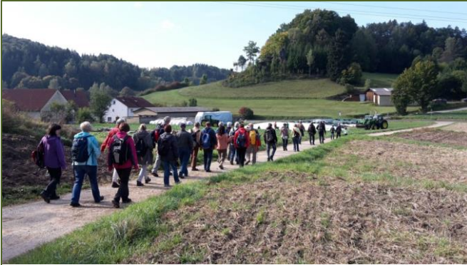
Die Wandergruppe bei Etzelwang

für die Wanderung von Etzelwang nach Neutras, zum Res´nhof, entschlossen. Zuvor machten wir eine Probewanderung, welche wir wegen der großen Hitze zweimal ver-