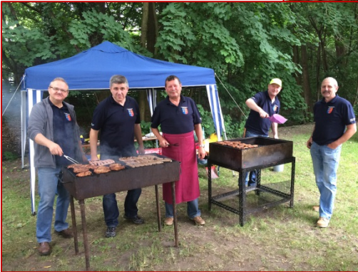
Links und unten: Grillstand und Kuchenbuffet am Begegnungsfest der Nikodemuskirche Nürnberg, am 21. Juni 2015