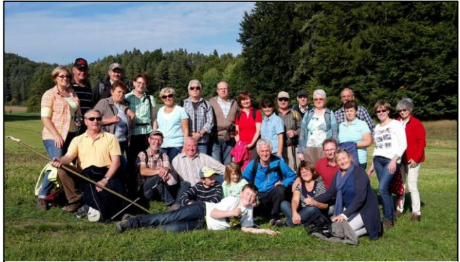
Gruppenfoto der Wanderfreunde

In Etzelwang hatten wir für unsere Gruppe in einem Cafe Plätze reserviert. Hier ließen wir diesen wunderschönen Tag bei einem großen Stück Kuchen und eine