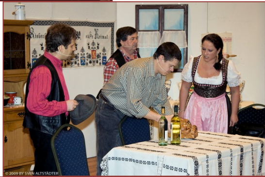
Kathrenjeball, 2012 (unten)