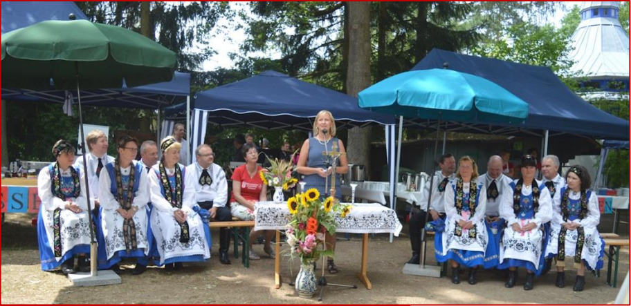
Oben: Sommerfest der Nachbarschaft Schwabach 12. Juli 2015