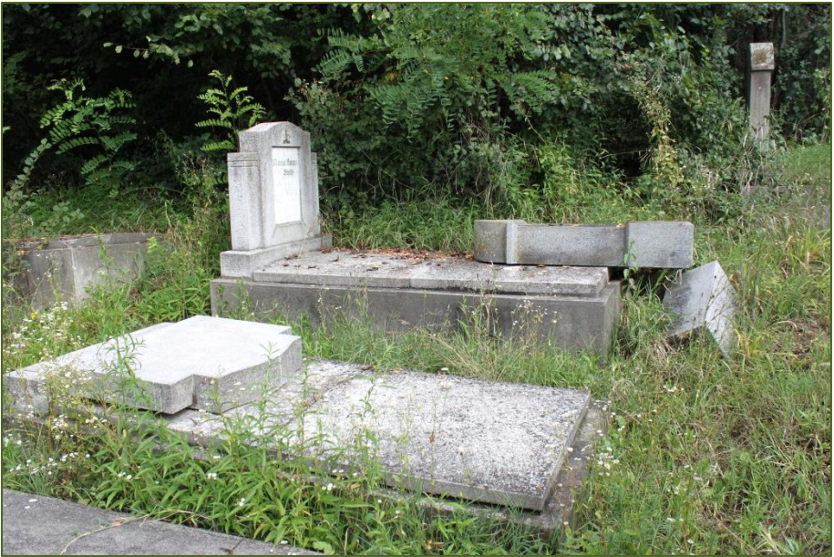
Umgekippte Grabsteine unterhalb des Robinienwäldchen

Nachdem ich im August dieses Jahres den Friedhof erneut besichtigte, habe ich versucht die Ursachen für den schlechten Zustand des Friedhofs herauszufinden. Folgende Gründe könnten hierfür ausschlaggebend sein: