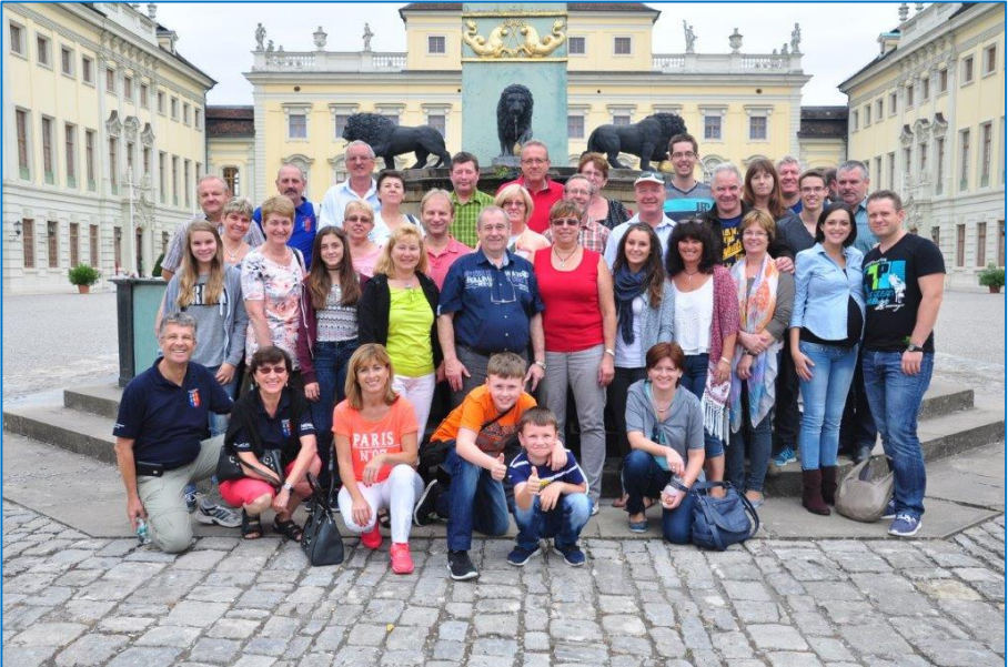
Gruppenfoto im Residenzschloss Ludwigsburg

Dschungelwelt. Danach haben wir den schönen Abend in unserer Hotelbar, bei einem Glas Bier oder Wein, ausklingen lassen. Am nächsten Tag, nach dem gemeinsamen Frühstück, ging`s mit dem Bus weiter nach Ludwigsburg, zur Besichtigung des Residenzschlosses. Es waren beeindruckende und unvergessliche Momente. Von dort sind wir nach Schwäbisch Hall gefahren, wo wir das schöne Altstädtchen und die Kirche besichtigt haben.