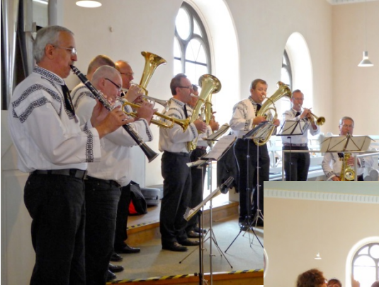
Adjuvanten, gemischte Chor „Sieb. Vocalis“ und Männerchor beim Festgottesdienst in der St.-Pauls-Kirche in Dinkelsbühl