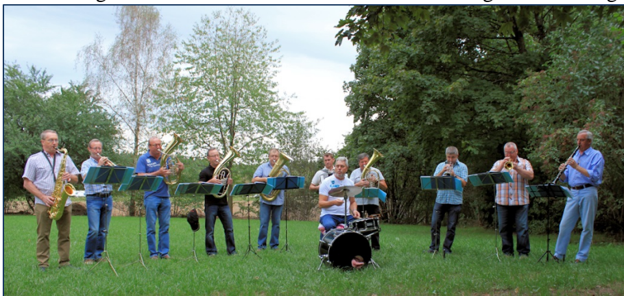
Auftritt am eigenen Sommerfest in Spardorf

Am 10. Oktober hatten wir am Zuckmantler Treffen unseren längsten Auftritt. Hier waren wir als Posaunenchor mit zwei Liedern und als Männerchor mit einem Lied Mittgestalter des Gottesdienstes, in der Johanneskirche in Nürnberg-Eibach. Am Nachmittag sorgten wir dann im Palmengarten mit bekannten Blasmusikstücken für gute Stimmung.