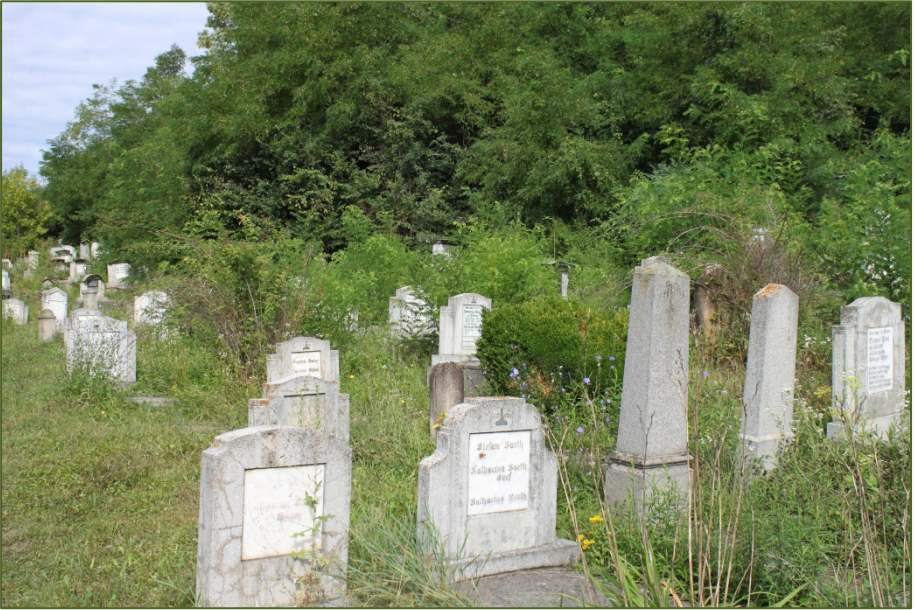
Blick über die unteren Friedhofsgräber

auf ihre guten Dienste und wünschen ihr beste Gesundheit, wohlwiegend dass ohne sie unsere Probleme vor Ort wesentlich größer sein würden.