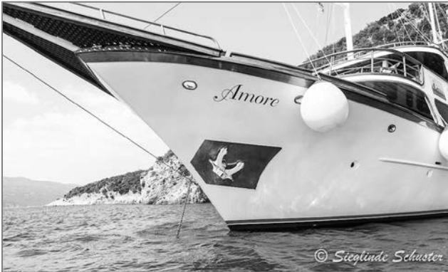
Motorsegler MS AMORE

Das Wort „jubilieren“ stammt laut Duden – Universalwörterbuch von dem lateinischen Wort „iubilare“ ab, was so viel wie „jauchzen“ oder „seiner Freude weniger laut als klingend Ausdruck verleihen“