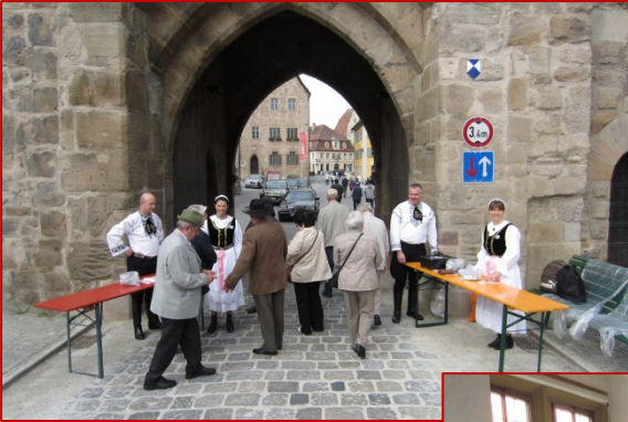
Links: Heimattag in Dinkelsbühl am 24. Mai 2015: Abzeichenverkauf am Wörnitztor