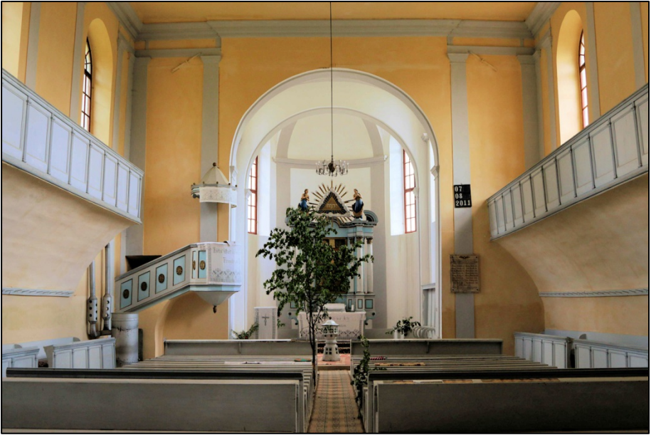
Mit einer Linde geschmückte Kirche zu Pfingsten 2015.

Zu meiner Person darf ich bekannt geben, dass ich 2016 beim Pfarramt Keisd angestellt werde. Meine Arbeit in der Diaspora Schäßburg werde ich nach bestem Wissen und Gewissen fortsetzen: in den Gemeinden Großlasseln (mit Rauthal, Waldhütten und Irmesch), in Nadesch (mit Marienburg, Zuckmantel und Maniersch), in Trappold (mit Schaas, Denndorf und Wolkendorf), in Arkeden (auch Weißkirch und Klosdorf). Dazu gehören auch Aufgaben im "Christlich Medizinischen Verein Lukas-Hospital" in Lasseln, im "Haus des Lichtes Weißkirch", einer Tagesstätte für Kinder mit Behinderung, sowie dem "Christlichen Verein Junger Menschen" in Arkeden, das sind drei Institutionen im Umfeld unserer Kirche, die auf dem evangelischen Menschenbild basieren und vertraglich untergebracht sind in kirchlichen Gebäuden. Ich betrachte die Mitarbeit in diesen Vereinen als einen Dienst an der Außenfront der Kirche, während die Gemeindegarbeit zum Dienst im Inneren der Kirche gehört, wobei das Heilige Abendmahl, die Predigt und der Hausbesuch das Herzstück ausmachen.