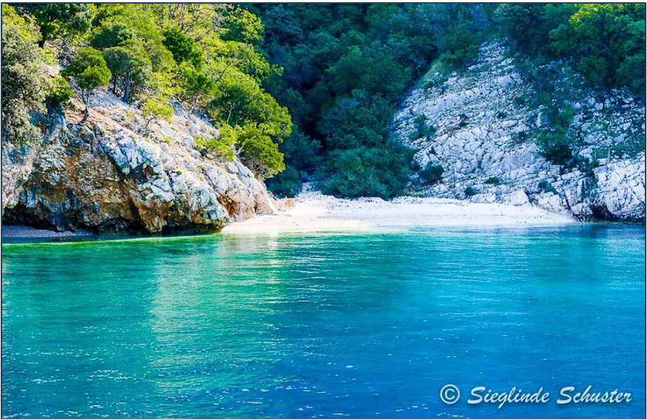
Einsame Bucht in der Adria

Einheimischen das Gefühl zu vermitteln, dass man sich mit ihnen verbunden fühlt, zeigte sich durch den Besuch und den spontanen Auftritt einer jungen Frau, die mit unseren Musikern bekannte englische Lieder sang. Fasziniert von diesem unerwarteten Intermezzo sangen die meisten Passagiere mit. Am Pier versammelten sich immer mehr Urlauber, herangelockt vom Zauber dieser Augenblicke. In den Genuss dieses Privilegs zu kommen, ist ein Luxus, den sich nicht jeder leisten kann. Einmalig war auch der Tanz der Delfine auf unserer Rückfahrt zum Hafen von Rijeka. Sieben erfüllte Tage auf einem traumhaften Schiff mit wunderbaren Menschen hinterlassen das nachhaltige Gefühl eines vollkommenen Urlaubs.