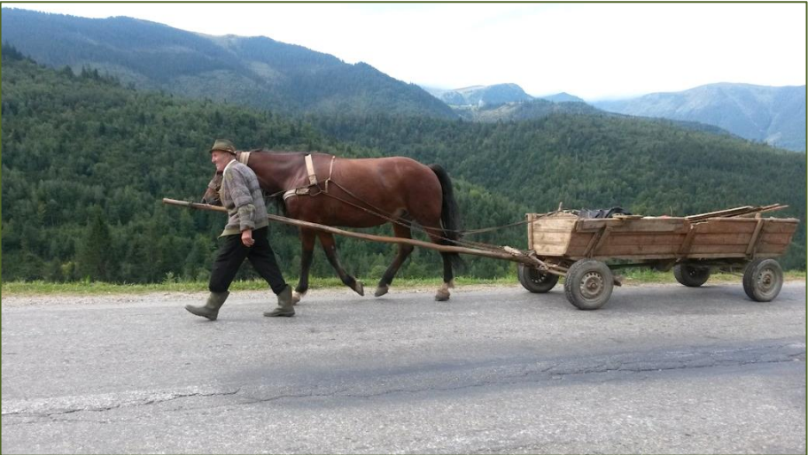
Typisches Pferdefuhrwerk in den Ostkarpaten

Ich kenne viele Landsleute, die oft aus den unterschiedlichsten Gründen unsere alte Heimat Siebenbürgen in Rumänien besuchen. Was zieht uns denn immer wieder hin in dieses Land, in dem unsere Vorfahren die Freiheit suchten? Dasselbe, wonach wir uns nach Jahrhunderten sehnten und zurück ins Ursprungsland flohen? Meine Gefühle überschlagen sich, ich bin hin und hergerissen. Kaum neigt sich das Schuljahr dem Ende zu, schwirren tausend Gedanken in meinem Kopf herum. Alles dreht sich nur noch darum, wie ich es auch in diesem Sommer einrichten könnte, wieder hinzufahren. Ich bin mir sicher, dass ich diesen Wunsch mit vielen anderen teile. Mittlerweile erachte ich es als selbstverständlich, mindestens einmal im Jahr diese Reise anzutreten. Es ist wie eine Gewohnheit, eine Tradition. Wenn bloß die lange Reise nicht wäre! Andere nehmen einfach einen Flug nach Klausenburg, Muresch oder Bukarest. Keine schlechte Idee, aber aus dem Flugzeug kann man alles nur überfliegen. Wir wollten genauer sein. Wir hatten Zeit, viel Zeit. Außerdem wollten wir einige Orte besuchen, die wir während unseres Lebens in Rumänien noch nicht