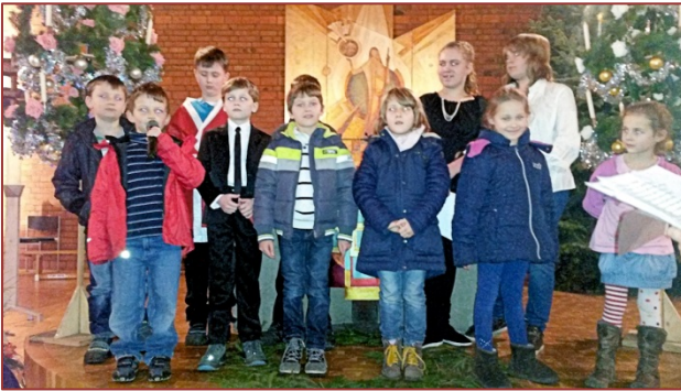
Darbietung der Kinder

ventskerzen die vorweihnachtliche Zeit darzustellen. Es war eine zauberhafte Geschichte, in der sich die vier Adventskerzen so lange darüber gestritten hatten welche von ihnen zuerst angezündet werden sollte, bis die Adventszeit rum war. Der Heilige Abend kam und der Streit wurde durch den Weihnachtsmann unterbrochen. Er nahm die etwas geknickten Kerzen vom Adventskranz und befestigte sie am Weihnachtsbaum. Hier zündete er alle vier gleichzeitig an. Nun konnten, durften und sollten sie im vollen Glanz erstrahlen.