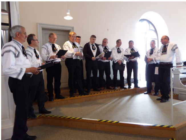
Gottesdienst in Dinkelsbühl

Am 14. Dezember 2014 waren wir mit zwei Liedern für Posaunenchor und einem Lied für Männerchor Mitgestalter des Adventsgottesdienstes.