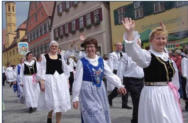
Unten rechts: Nadescher Weinflasche bei der Ausstellung im Spitalshof Fotos: hgb