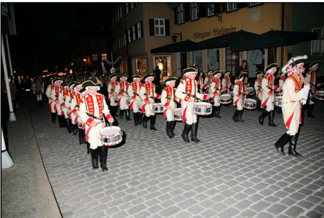
Knabenskapelle Dinkelsbühl auf dem Weg zum Großen Zapfen- streich an der Gedenkstätte.

Aus: Siebenbürgische Zeitung vom 10. Juni 2015, Seite 7