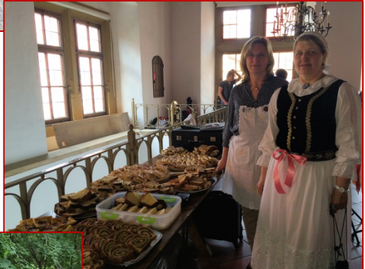
Rechts: Heimattag 2015. Kuchenverteilung bei der Brauchtumsveranstaltung in der Schranne