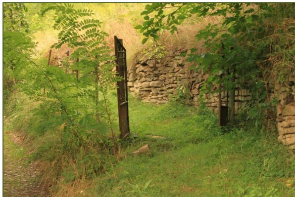
Der Friedhofseingang wie im Dornröschenschlaf

Es gibt kaum Nadescher Landsleute die beim Besuch ihrer alten Heimat nicht auch die Kirchenburg und den angrenzenden Friedhof besichtigen.